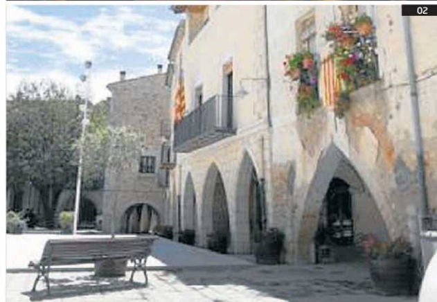
02. La plaça Gran de Peralada, on hi havia la casa de Muntaner.

es convidarà els principals experts en la figura i l'obra de Ramon Muntaner. Per als nens en edat escolar, Peralada prepara una visita teatralitzada al nucli antic i un taller d'escriptura medieval. A més del claustre romànic de Sant Domènec, restes de muralla i la portalada d'entrada a la població, Peralada guarda del seu passat medieval peces i documents, que s'exhibeixen al Museu de la Vila, on hi ha un exemplar de la Crònica de